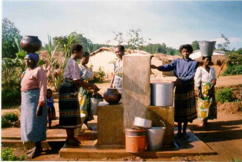
Vannkran i Malawi