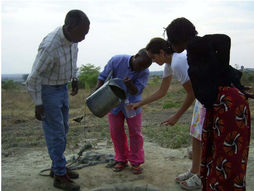
Kine er med og henter vann i en vanlig brønn i Kasungu

Rundt brønnen finnes det hus med hager og gårder. Men det er ingen sperrer, som for eksempel gjerder, som skiller gårdene og brønnen. Frittgående dyr beiter rundt brønnen siden det vokser gress der, men ellers er det lite vegetasjon. For å få hentet opp vann fra brønnen bruker de et tau med en metallbøtte festet i enden. Store deler av befolkningen i Malawi henter drikkevannet sitt fra brønner som denne.