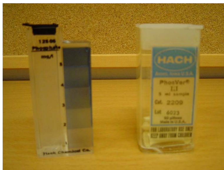
Utstyr til fosfatmålinger

Vi skulle finne ut av fosfatinnholdet i vann. Vannet vi testet var fra kran og brønn fra Norge og kran, brønn, sjø og borehull i Malawi. Først fylte vi en sylinder med vann, og tilsatte fosfatindikator. Deretter ristet vi løsningen i ca. 1 minutt. Vi skulle se om det ble noen forandring i vannet, om løsningen skiftet farge. Jo mer løsningen skiftet farge, jo mer fosfat var det i vannet. Resultatet skulle vi lese av ved å sammenlikne fargen med en gitt fargeskala.