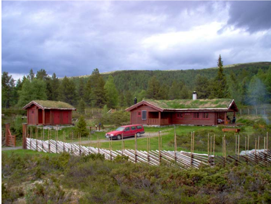
Hytta på Hemstadvangen hvor vi hentet vannprøven fra brønnen