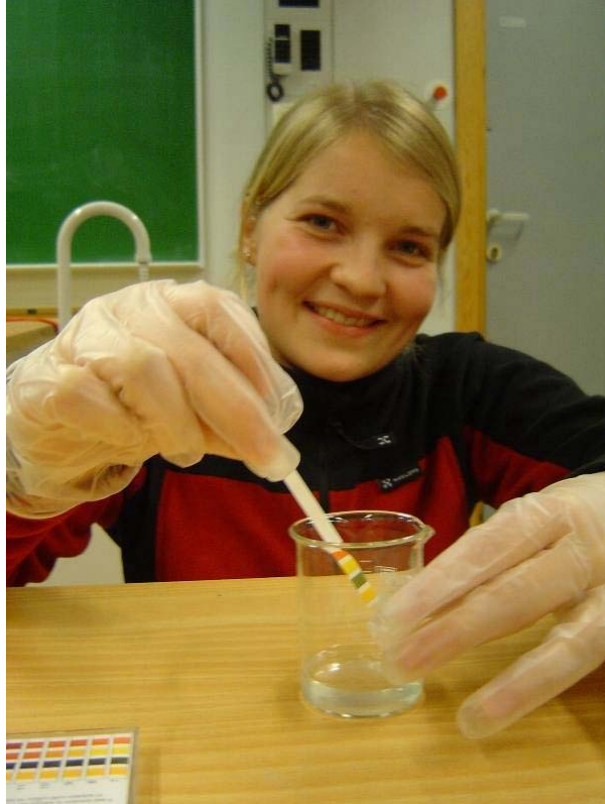
Maren måler pH i en vannprøve