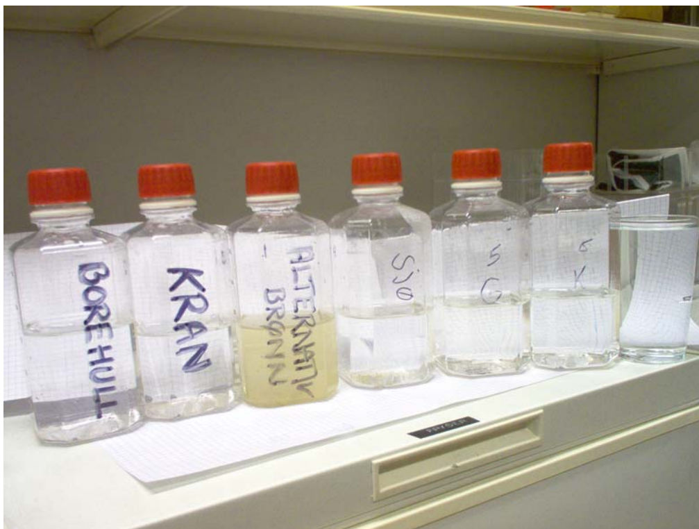
Vannprøvene vi analyserte

Vi ser ut fra bildet at det er forskjell på prøvene. Flaska som skiller seg tydelig ut på bildet (nummer tre fra venstre), er vannprøva fra den vanlige brønnen i Kasungu.