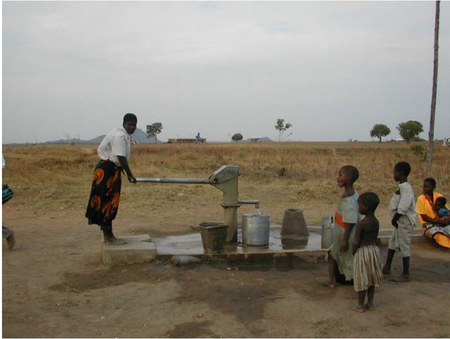
Borehull i Kasungu