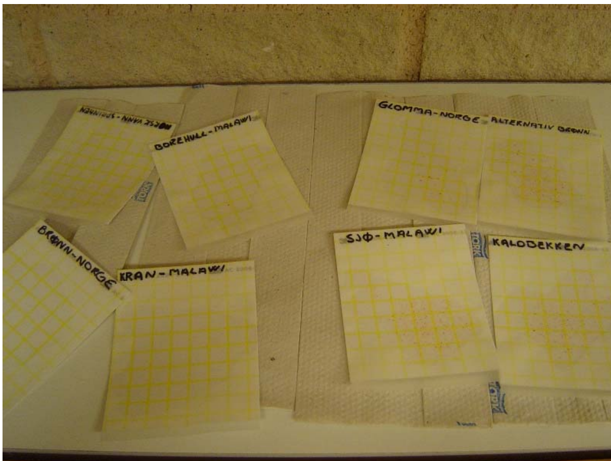
Bakteriekolonier som skal telles